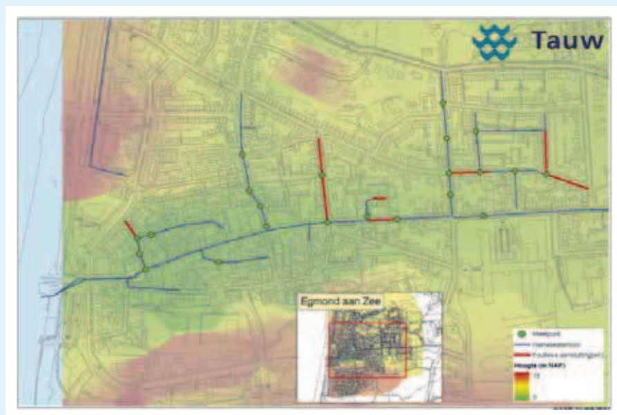
Afb. 2: Overzicht regenwaterstelsel Egmond aan Zee met meetpunten voor temperatuur en waterkwaliteit. Rood zijn strengen met foutieve aansluitingen.

Foutieve aansluiting in Egmond aan Zee: instroom in het regenwaterriool in een droge periode en duidelijke sporen van schoonmaakmiddelen. Vaak zijn foutieve aansluitingen niet zo duidelijk, maar alleen te herkennen aan bijvoorbeeld een vetrandje.