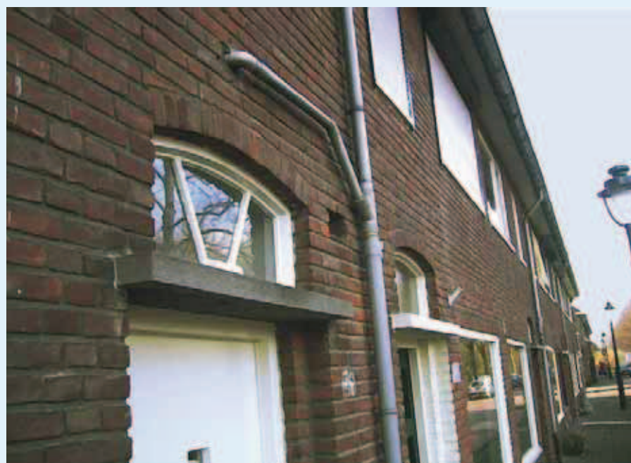
Een foutieve aansluiting van een badkamer op de regenwaterafvoer.

Afbeelding 1 toont de gemeten temperatuur en neerslag gedurende een week voor een locatie in Egmond aan Zee. De temperatuurmetingen tonen de aanwezigheid van een foutieve aansluiting. De temperatuurstijgingen in de ochtend en avond in een droge periode duiden op lozingen van afvalwater naar het regenwaterriool (van bijvoorbeeld douchen en koken). De zichtbaarheid van foutieve aansluitingen is afhankelijk van onder meer de temperatuur buiten en in het riool, alsmede de afstand van de foutieve aansluiting tot het meetpunt. Om de methode te verifiëren, is naast de temperatuur het verloop van het waterniveau gemeten, zijn steekmonsters op diverse stoffen onderzocht en videobeelden geanalyseerd. Waar temperatuurmetingen aangaven dat er foutieve aansluitingen op